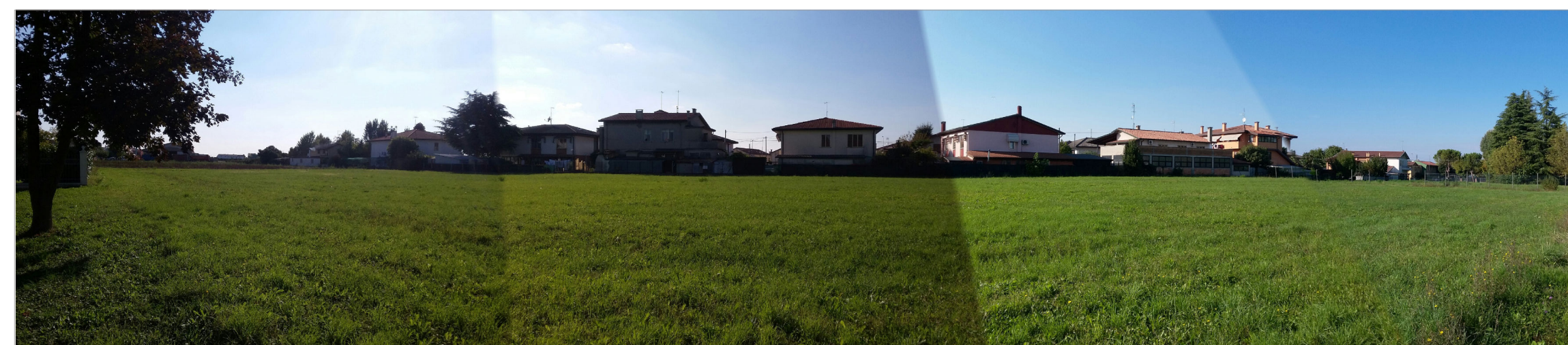
CONO DI RIPRESA N.4