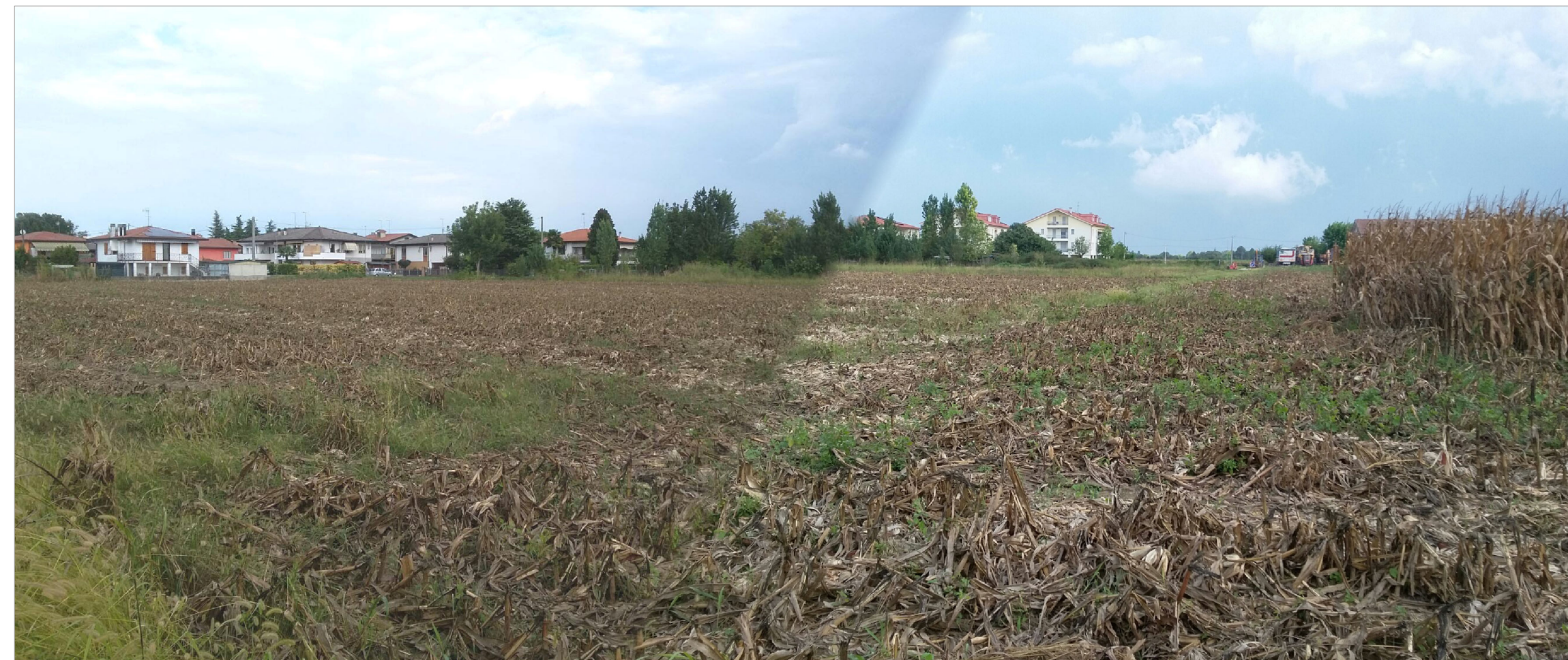
CONO DI RIPRESA N.2