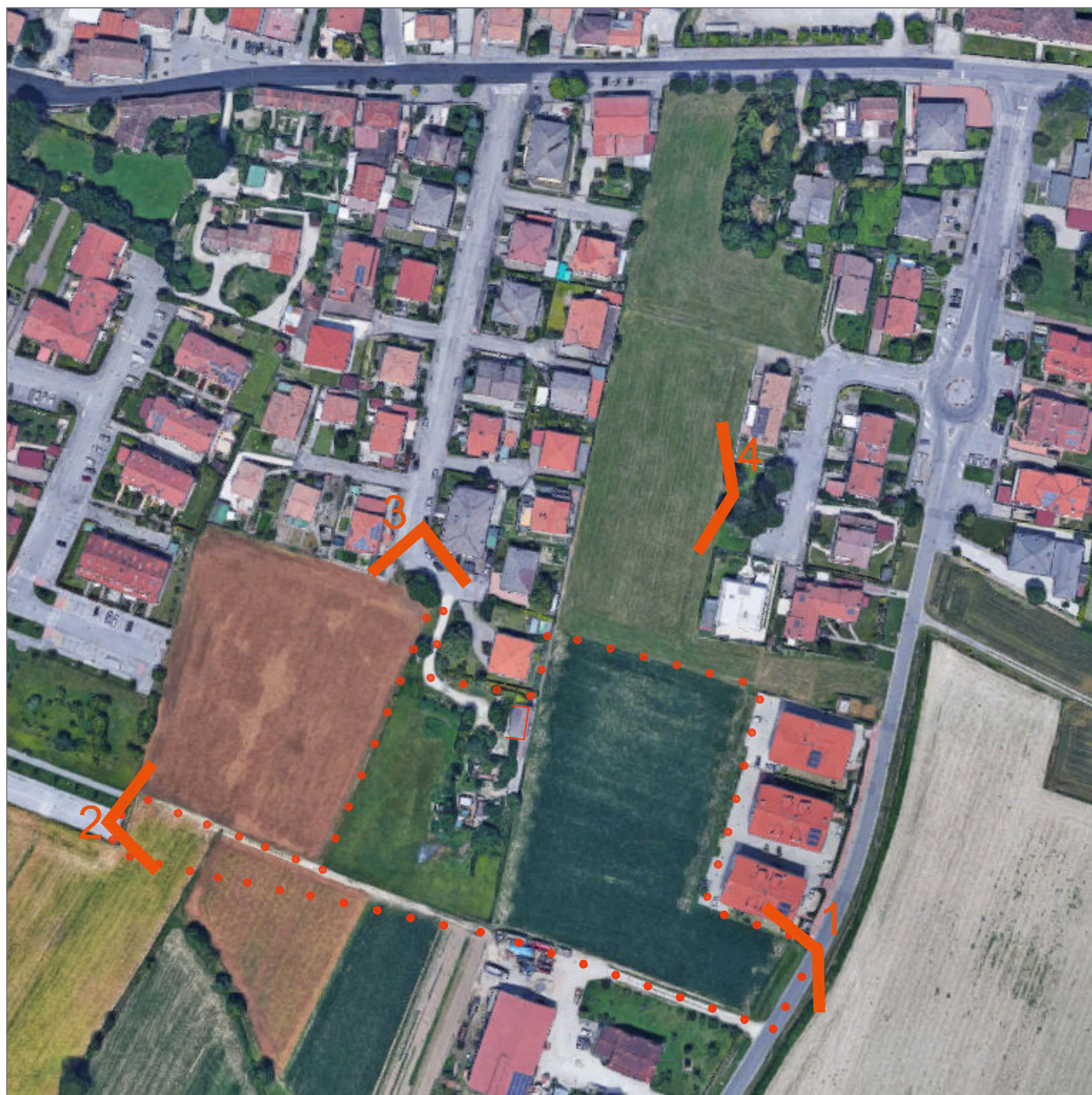
FOTO AEREA CON INDICAZIONE DEI CONI DI RIPRESA FOTOGRAFICA