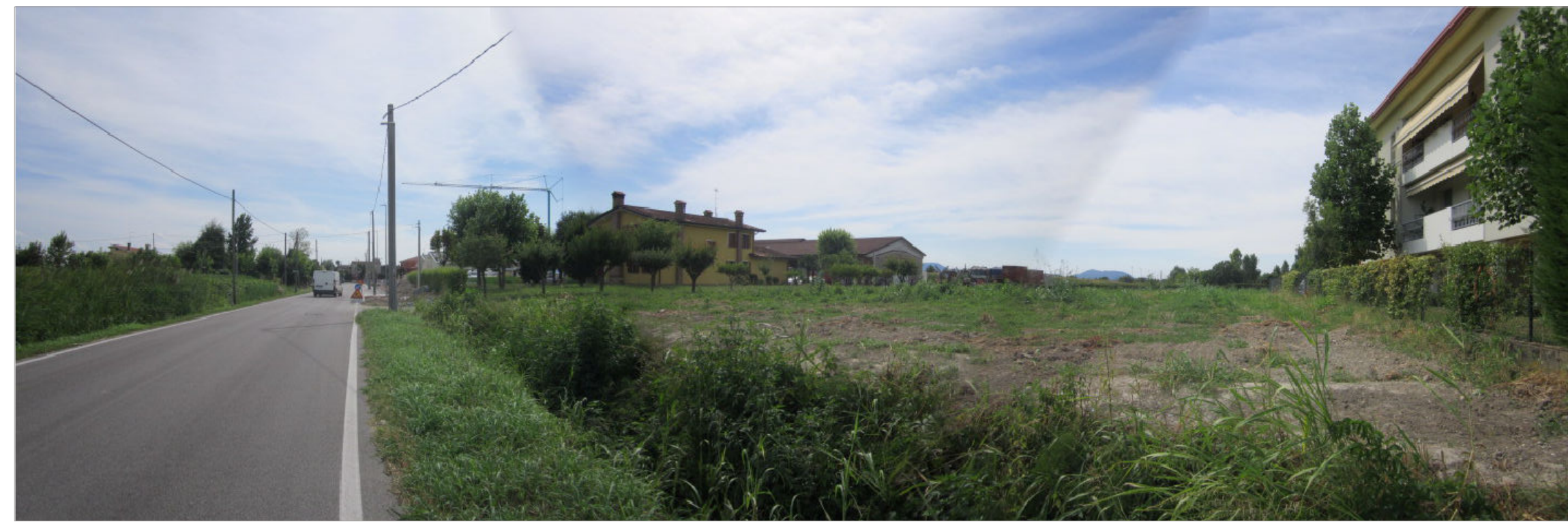
CONO DI RIPRESA N.1