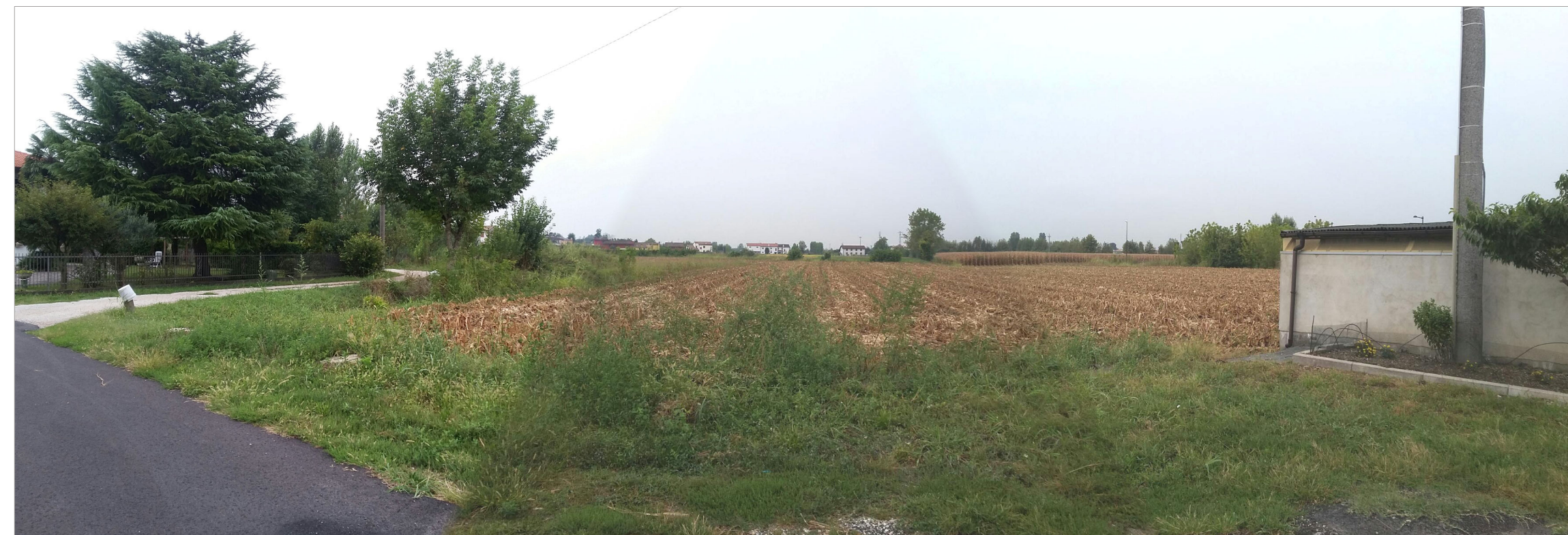
CONO DI RIPRESA N.3